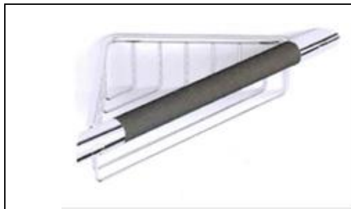
Alterna U Line zeephouder hoekmodel chromom