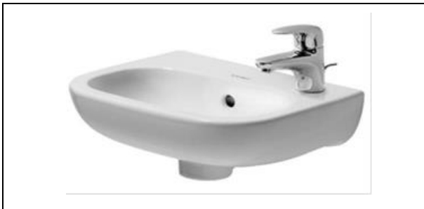
Duravit fontein wit