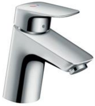
Hans Grohe wastafelmengkraan chroom