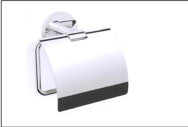
Alterna closetrolhouder chroom