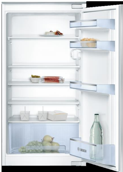
Bosch integreerbare koeler