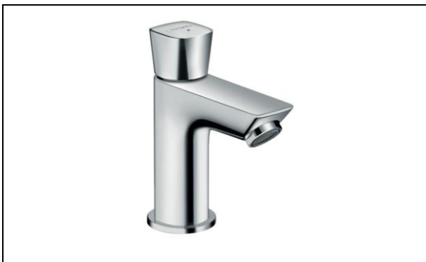
Hans Grohe fonteinkraan chroom