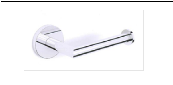
Alterna Reserverolhouder chroom