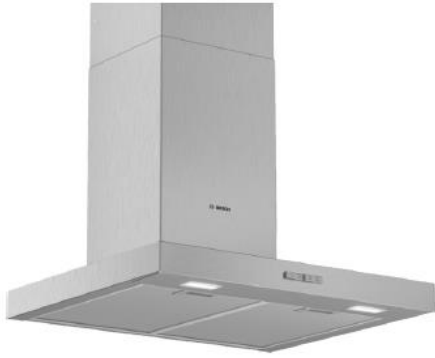
Bosch wandschouwkap, roestvrij staal