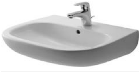
Duravit Wastafel wit