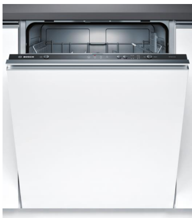
Bosch geïntegreerde vaatwasmachine