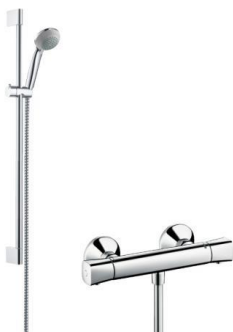
Hans Grohe douchemengkraan chroom