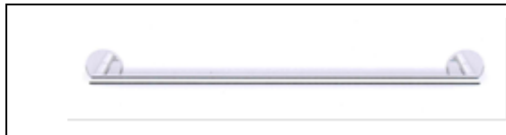
Alterna Handdoekrek chromom